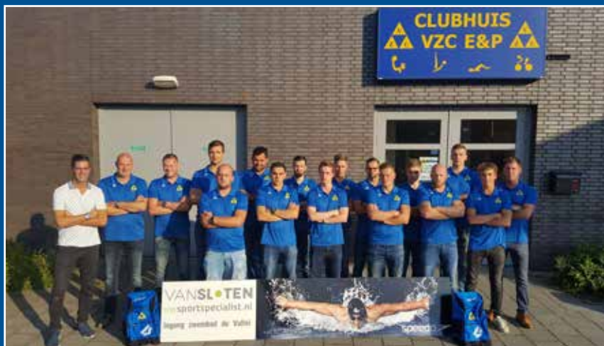
Heren 1 selectie seizoen 2016-2017

Genoemde prijzen zijn op jaarbasis en indien er BTW verschuldigd is, dan wordt deze in rekening gebracht.